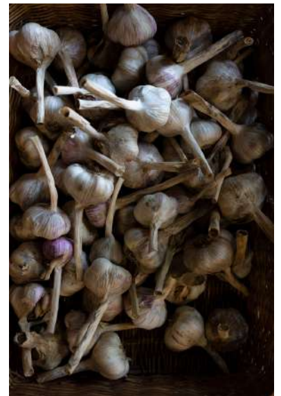
DOMAINE DU PATERNEL, MARAICHER