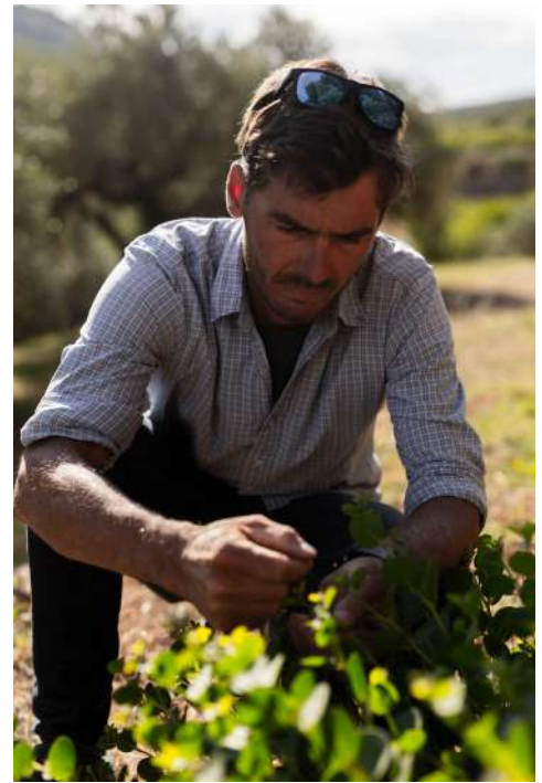
DOMAINE DE LA MICHELLE